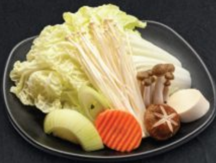
ชุดผักสุกี้ยากี้, ซาบู ซาบู 150 Sukiyaki, Shabu Shabu Vegetable Set