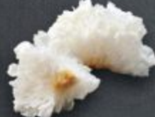
เห็ดหูหนูขาว 60 White Jelly Fungus 白きくらげ