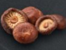
เห็ดหอม 60 Shiitake Mushroom しいたけ