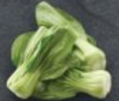
กวาดุ้งฮ่องเต้ 70 Bok Choy チンゲン菜