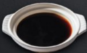
น้ำซุปลุกียากิ Sukiyaki Soup すき焼き スープ

น้ำซุปลุกียากิ ซุปเข้มข้นสูตรพิเศษรสชาติต้นตำรับญี่ปุ่น