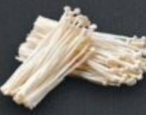
เห็ดเข็มทอง 60 Golden Needle えのき