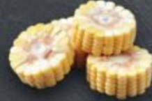
ข้าวโพด 60 Corn トウモロコシ