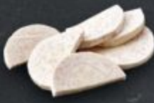
เผือก 60 Taro タロイモ