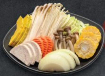
ชุดผักปิ้งย่างอะคิยาเก้ 150 Akiyaki Vegetable Set