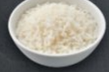
ข้าวญี่ปุ่น 30 Japanese Rice 白ご飯