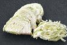
กะหล่ำปลี 60 Cabbage キャベツ