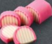
คามาบโอะโกะ 90 Fish Cake (Kamaboko) かまぼこ