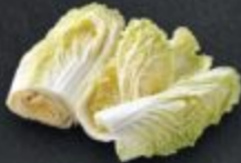
ผักกาดขาว 70 Chinese Cabbage 白菜