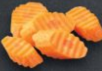
แครอท 60 Carrot ニンジン