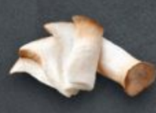
เห็ดออริจิ 80 Eringi Mushroom エリンギ