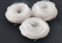
วุ้นเส้น 60 Vermicelli 春雨