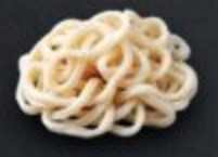
เส้นอุด้ง 60 Wheat Noodles うどん