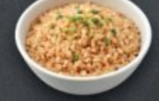
ข้าวพืดกระเทียม 50 Garlic Rice にんにくライス