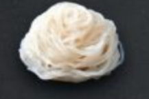
เส้นบุก 70 Konjac Noodles しらたき