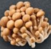
เห็ดชิมะจิ 80 Shimeji Mushroom しめじ