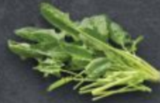
ผักโขม 70 Spinach ほうれん草