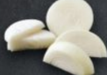
หอมหัวใหญ่ 60 Onion 玉ねぎ