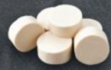
เต้าหู้ 60 Tofu 豆腐