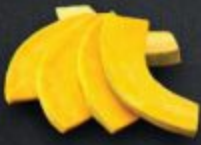
ฟักทอง 60 Pumpkin カボチャ