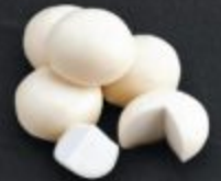
โมจิ 90 Japanese Rice Cake 餅