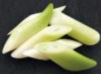
ต้นหอมญี่ปุ่น 60 Japanese Leek 長ねぎ